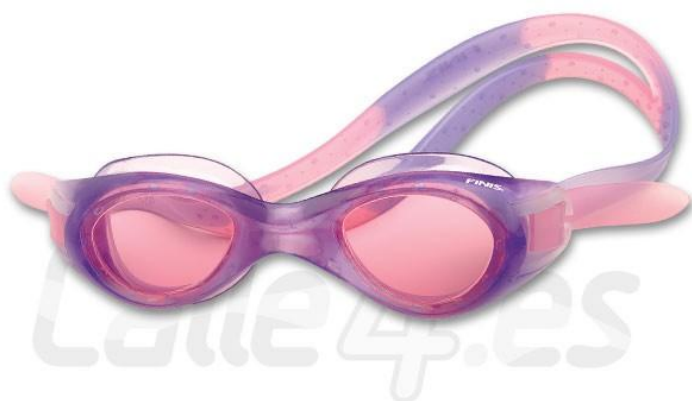
Foto.-Gafas de buceo, no son juguete acuático.