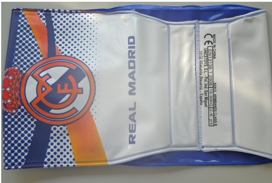
Foto.- Manguitos, no son juguete acuático, es un artículo de ayuda a la flotación.