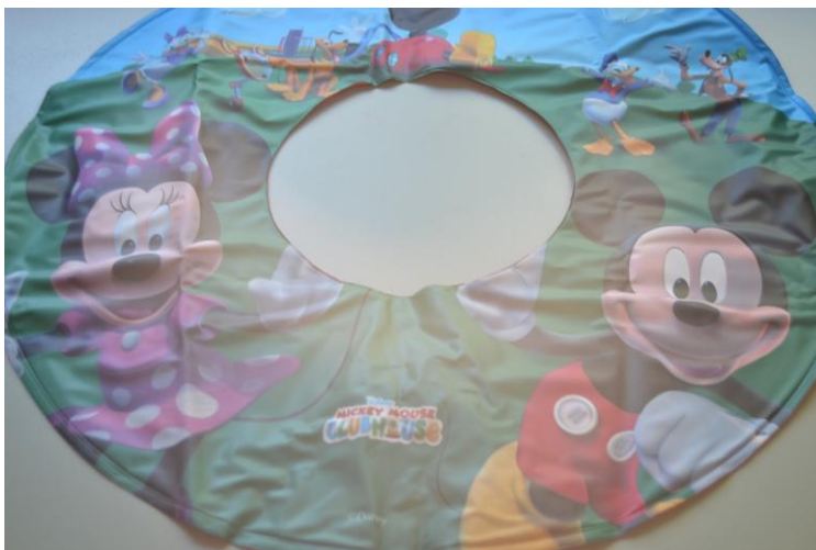
Foto.- Flotador de aro liso, es juguete porque lo indica el fabricante en el etiquetado.