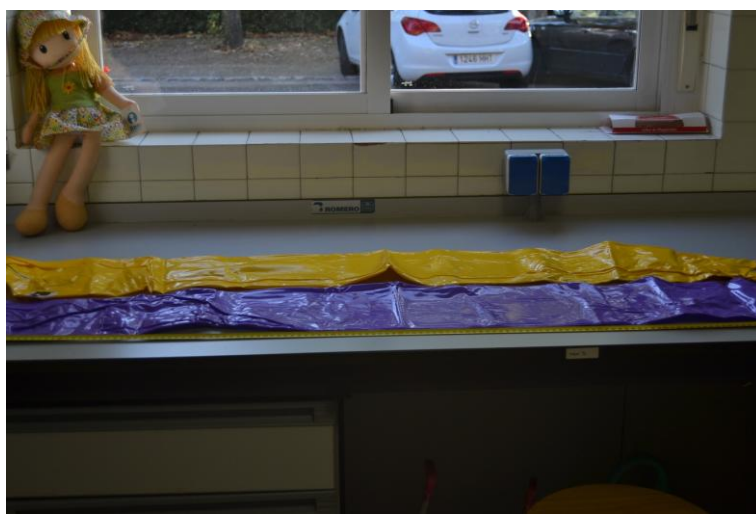
Foto.- Juguete acuático