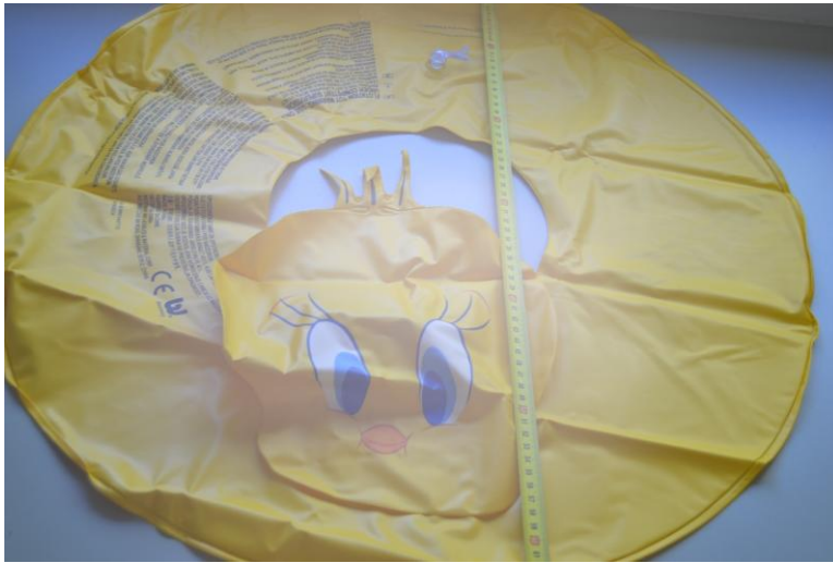
Foto.- Juguete acuático

Flotadores de aro lisos. -Estos productos, anillos hinchables, pueden estar incluidos en distintas categorías de productos: