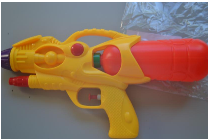
Foto.- Pistola de agua, no es un juguete acuático