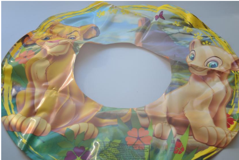
Foto.- Flotador de aro liso, es juguete porque lo indica el fabricante en el etiquetado.